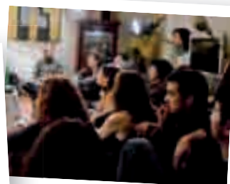
Público viendo la obra en su domicilio